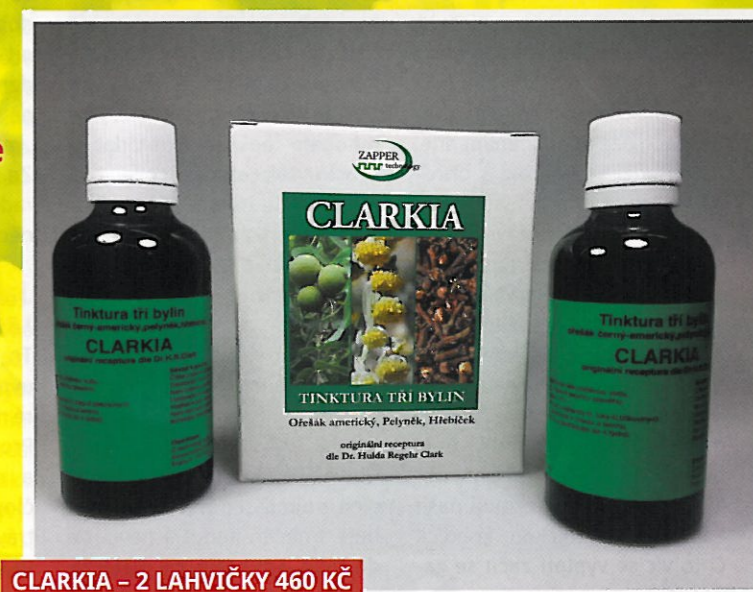
CLARKIA – 2 LAHVIČKY 460 Kč

Esoterický festival - Dny tajemna a zdraví