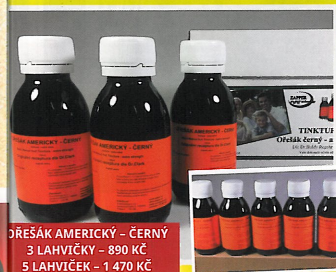
OŘEŠÁK AMERICKÝ – ČERNÝ 3 LAHVIČKY – 890 Kč 5 LAHVIČEK – 1 470 Kč

Prvotřídní čistota a kvalita Ořešáku amerického z chráněného území!