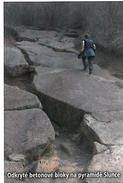
Odkryté betonové bloky na pyramidě Slunce