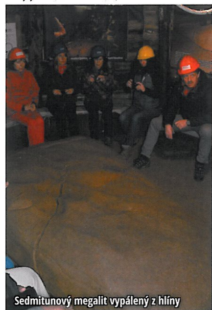
Sedmitunový megalit vypálený z hlíny

Při průzkumu se ukázalo, že pyramidy mají přesnou orientaci sever – jih. Dále se ukázalo, že kopce, které nám zatím neznámá civilizace upravila do potřebných tvarů a potom je obložila pískovcovými a betonovými bloky, jsou přírodního původu. Tyto bloky jsou 4,5 m dlouhé, 1,5 m široké a 45 cm sil-