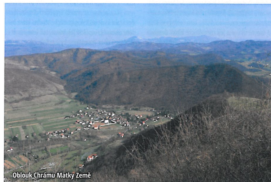
Oblouk Chrámu Matky Země

I bosenská pyramida měsíce je se svou výškou 190 m větší než ta Cheopsova. Horní vrstvy této pyramidy jsou provedeny z lepených pískovcových desek.