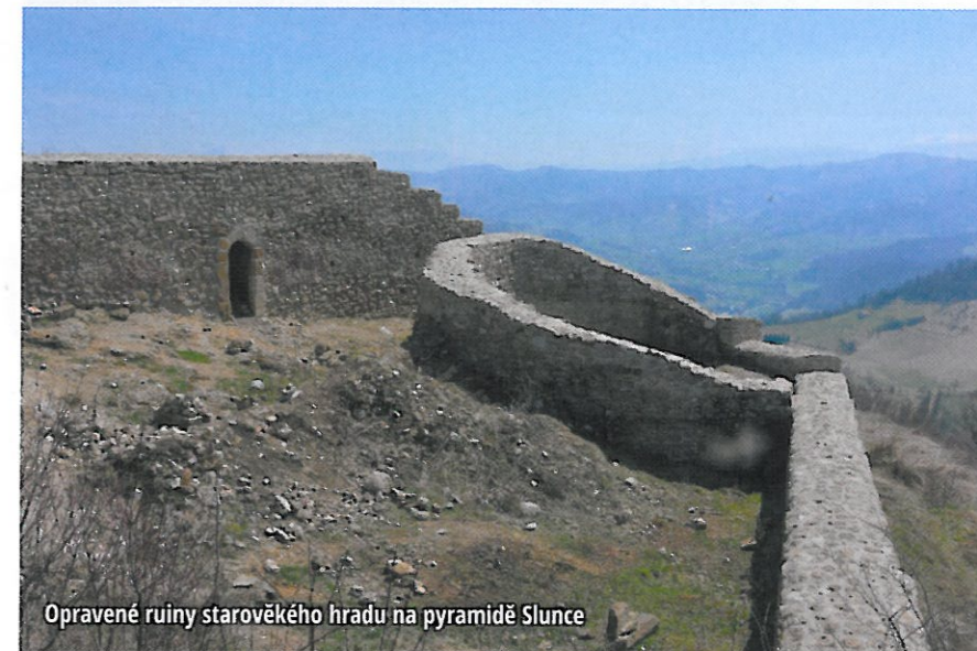
Opravené ruiny starověkého hradu na pyramidě Slunce