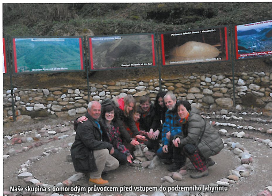
Naše skupina s domorodým průvodcem před vstupem do podzemního labyrintu