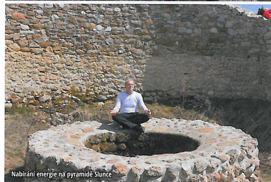
Nabírání energie na pyramidě Slunce

Radiokarbonová analýza, kterou provedl odborný fyzikální ústav, potvrdila stáří pyramidy Měsíce na 10 350 let před naším letopočtem. Pod pyramidou se akumuluje spodní voda, která je spojená s podzemními jezery.