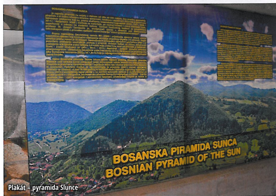
Plakát – pyramida Slunce

lety museli lidé držet při sobě, aby dokázali vytvořit tak úžasná díla, jako jsou třeba pyramidy. Nemyslím si, že to stavěli nějakí otroci, jak se nám věda snaží vnutit, ale duchovně vyspělé bytosti, které chtěly žít v souladu s přírodou, s naší úžasnou matičkou Zemí.