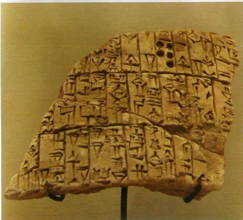
Fragment z jílového kužele s částí přepisu „Code Urukagina“ – reformou krále Urukagina pochází z 2380–2360 př. n. l.